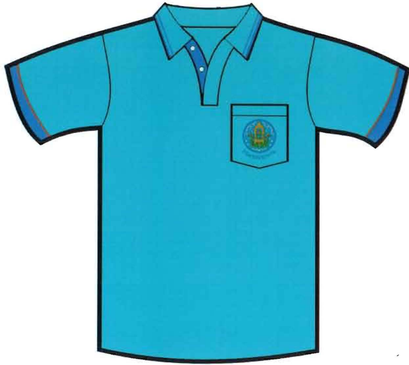
ด้านหน้า